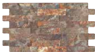
Muretto cacao 25 40,5x23,5/15,9"x9,2"