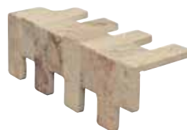
Muretto chiaro coprispigolo 43 23,5x8x8/9,2"x3,1"x3,1"