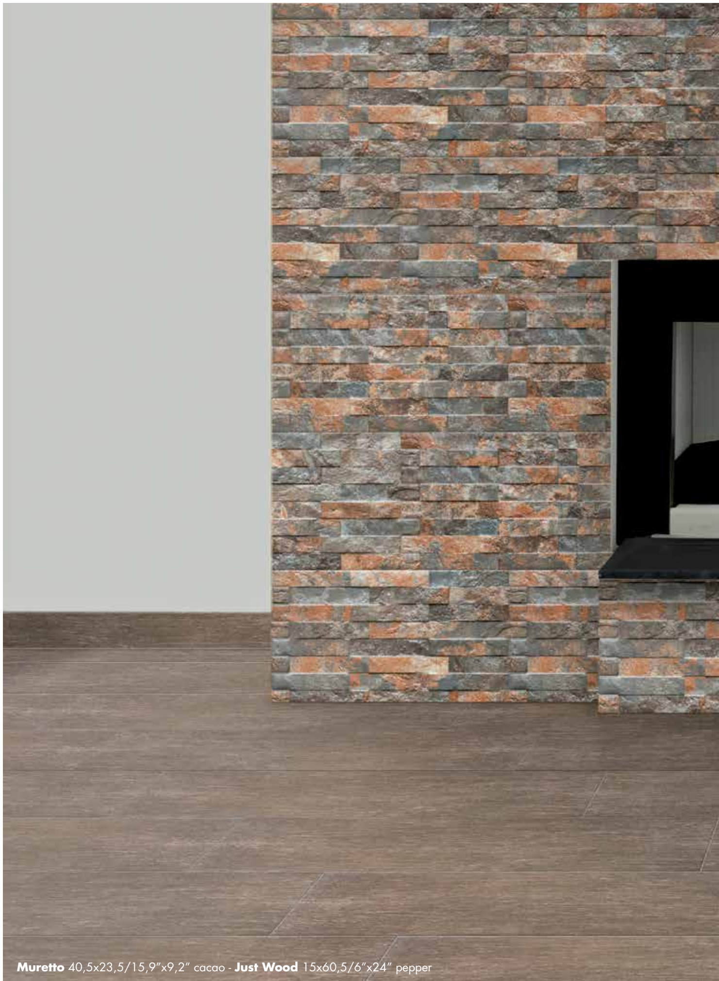
Muretto 40,5x23,5/15,9"x9,2" cacao - Just Wood 15x60,5/6"x24" pepper