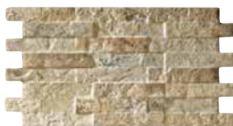
Muretto chiaro 25 40,5x23,5/15,9"x9,2"