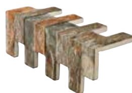
Muretto cacao coprispigolo 43 23,5x8x8/9,2"x3,1"x3,1"