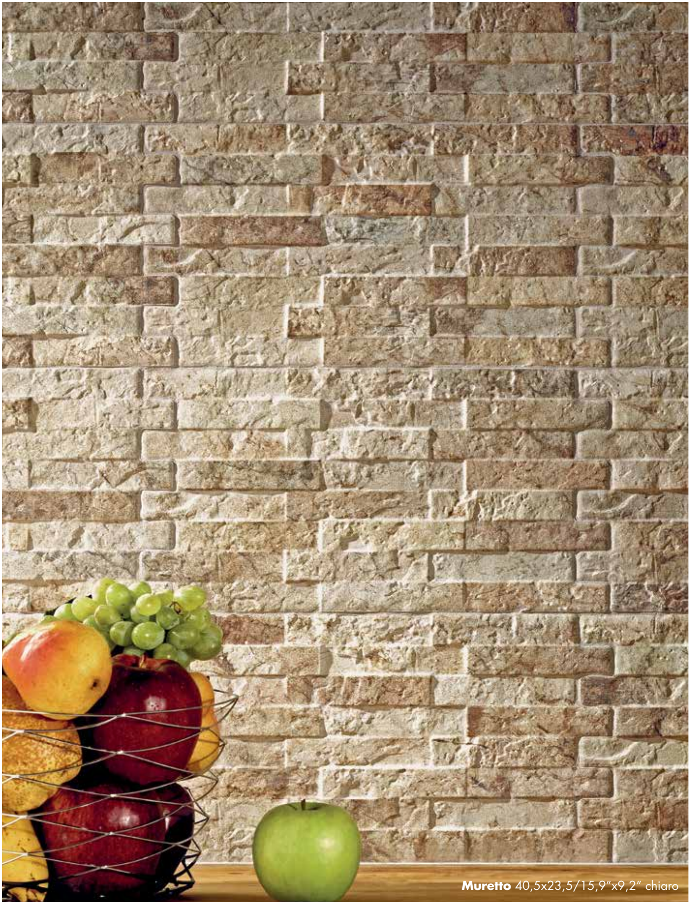
Muretto 40,5x23,5/15,9"x9,2" chiaro